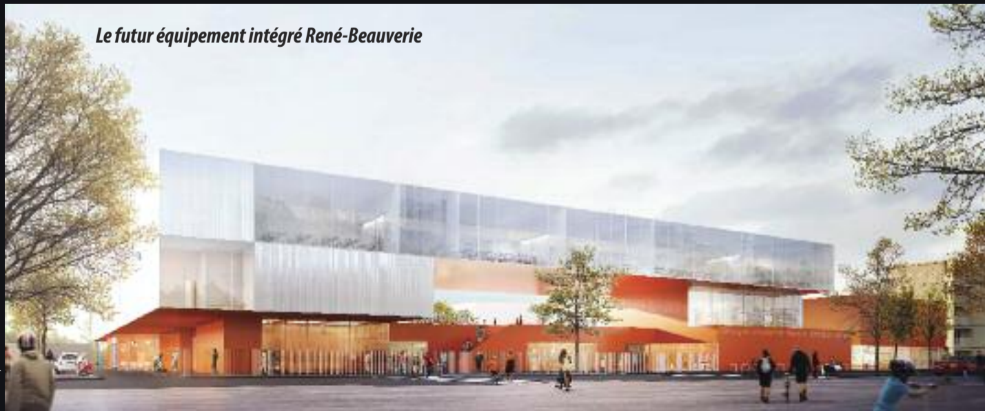
Le futur équipement intégré René-Beauverie